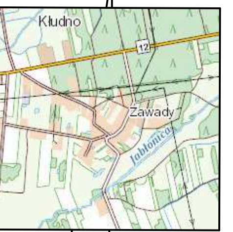
SZKIC ORIENTACYJNY skala 1:25 000